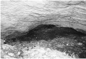
Entrée de la grotte du Cliot de Tsèrafouén

» L'embranchement droit (ouest) du «y» est le plus vaste: douze mètres de long, deux mètres de large et deux mètres cinquante de haut environ. Les inscriptions y sont moins nombreuses. Après sept mètres environ, on constate un changement de niveau de près d'un mètre. De l'eau semble s'y être écoulée au cours des mois précédents. A l'extrémité se trouvent deux issues, celle de gauche permettrait éventuellement de poursuivre l'exploration à travers un passage très étroit, celle de droite suffit à l'écoulement de l'eau.