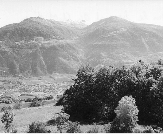
Vue sur le bosquet du Cliot de Tsèrafouén, depuis Montana

a l'omo tandes quié liè chè concholâvè ein dejein quié lanmâvè to lè j'einfan di j'âtro comein che fôchan lè chio; è irè tozo prèsta a idjiè lè mi pouro, hlou quié mancâvôn dou nèssèssério ein lou baliein caquiè véivèrè: pan, farena, tsèr, pomètè, tsou è ôncò Bén d'âtrè tchioujè; è irè lanmâvè dè tués.