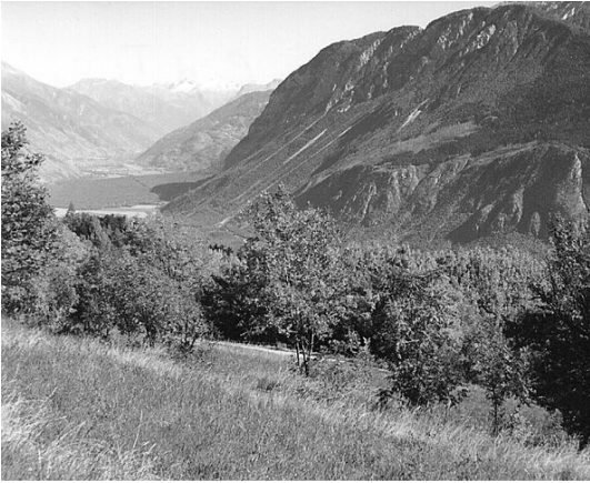
Vue sur le bosquet du Cliot de Tsèrafouén, depuis Chermignon

l'omo yè h'ènôn fou dè raze . Le fèna irè pâ ènouaye foula, mâ chè irè lachiaye montâ la téha pè lè j'âtrè quié iran zaloujè dè luéc. Chén mi ateindrè, reintrè y j'éhro è trouvé la fèna lotor dou foyèt quié préparâvè la séina. «Couè t'â-te pri dè fèrè dè tchioujè dénchè? t'â fran einvede dè nô