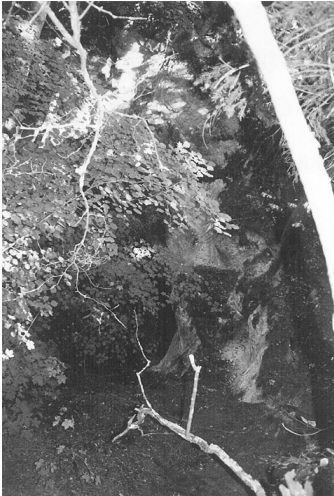
Paroi sud du Cliot de Tsèrafouén, hauteur 13 mètres

Dans un mouvement de colère incontrôlable, l'homme oubliant son engagement et entrant chez lui, d'une voix courroucée, lança à son épouse: «Qu'as-tu fait là misérable, pourquoi avoir voulu me ruiner, vile détalonnée 1 ».