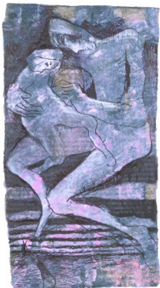
Maternité, d'Antonie Burger, œuvre de 2007.