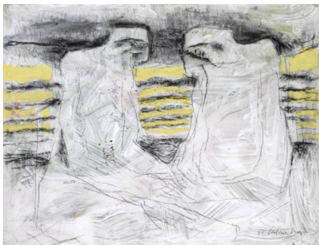
A deux, d'Antonie Burger, œuvre de 1995.