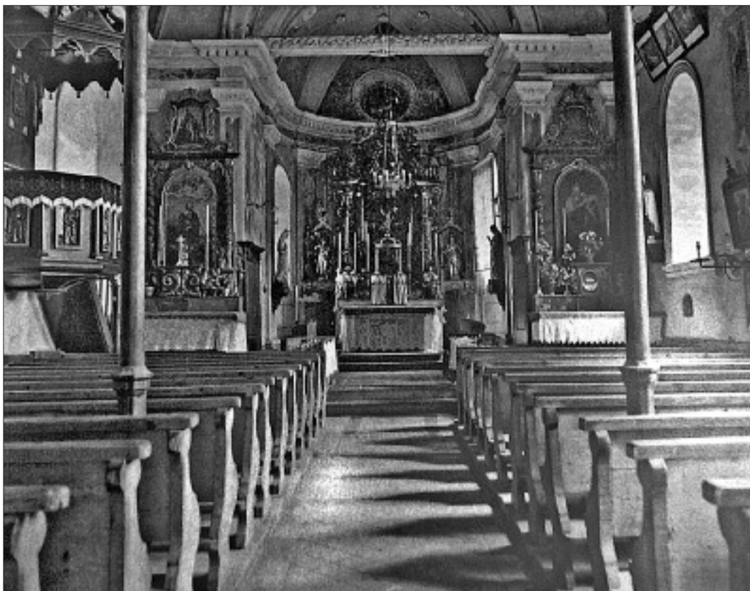
Intérieur de l'ancienne église de Montana construite durant les années 1851 et 1852.

Aussi, l'Evêque consécrateur fait-il trois fois le tour de l'édifice en disant et redisant: Au nom du Père, et du Fils et du Saint Esprit; et pourquoi? C'est pour en prendre possession solennelle au nom de l'auguste trinité divine.