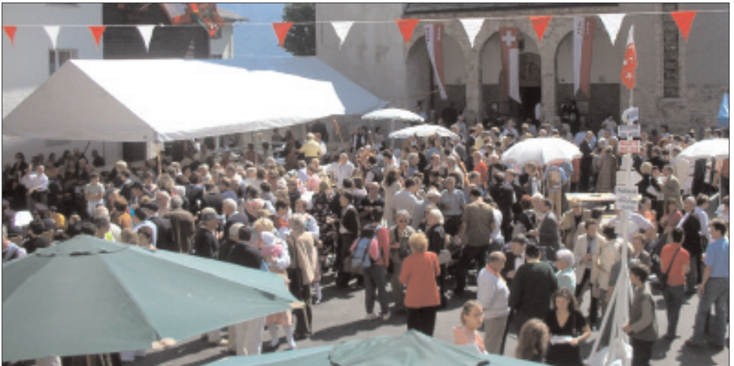
Fête après la consécration de l'autel de l'église rénovée: Montana, le 2 septembre 2007.

Après de longs mois de travaux de rénovation, l'église paroissiale St-Grat de Montana a été rendue aux fidèles lors de la cérémonie du 2 septembre 2007. En écho à cette inauguration et à la plaquette souvenir publiée à cette occasion, L'Encoche propose des extraits de l'enseignement de l'évêque Pierre-Joseph de Preux lors de la consécration de l'église paroissiale de Montana le 19 septembre 1868. Cette église, démolie en 1935 à l'exception du clocher, a laissé place à l'édifice actuel, reconstruit la même année sur l'emplacement du cimetière de la première église.