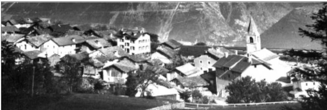
Le village de Montana dans les années 1930 autour de son église, édifice construit en 1851 et 1852 au nord du clocher.

vous était donc la pensée de bâtir une église paroissiale lorsque vous posiez les fondements de cet édifice qui est ici debout devant nous. Vous veniez même de contribuer de bon cœur à la reconstruction de la vaste et belle église paroissiale de Lens et de l'habitation des prêtres attachés à cette église. Mais c'était Dieu par contre qui y pensait parce que, comme le fait le prouve, Dieu avait arrêté dans ses décrets, dans sa bonté, pour vous, que Montana serait paroisse un jour, il voulait faciliter les moyens du salut que la distance de l'église mère, la rigueur de la mauvaise saison sur cette hauteur surtout, et parfois la rigueur du chemin, rendaient bien difficiles et toujours trop rares pour la ferveur de votre piété. (...)