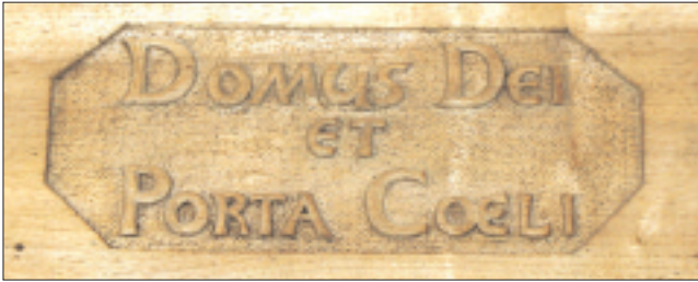
L'inscription Domus Dei et Porta Coeli figurant sur la porte d'entrée de l'église actuelle, formule très souvent reprise par l'évêque de Preux.

comprenez, Chers Frères, que c'est là une manière de parler, une expression métaphorique et figurée, mais dont vous saisissez de prime abord le sens propre et réel; sens qui n'est autre que celui-ci, que cet édifice par sa consécration deviendra pour vous un moyen efficace de salut, la voie pour arriver au Ciel; que c'est en lui que vous trouverez l'entrée du Ciel; et comment cela? (...)