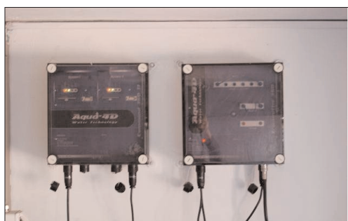
Une partie de l'installation électronique.

électromagnétiques. Aujourd'hui, ces ondes naturelles sont de plus en plus influencées et perturbées par des ondes techniques issues des télécommunications, de l'armée, de la télévision, etc. Ces ondes parasites changent quasiment le fonctionnement naturel, comme a pu le constater Planet Horizons en analysant l'écosystème de certains lacs. En combinaison avec des éléments nutritifs provenant des surfaces cultivées voisines, les problèmes d'eutrophisation dus à la multiplication des algues deviennent inévitables.