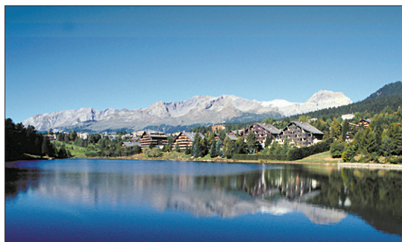
Le lac Moubra.

Planet Horizons Technologies est aujourd'hui l'une des premières entreprises au monde qui vise concrètement à la dépollution électromagnétique .